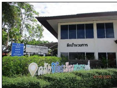
อาคารสำนักงาน