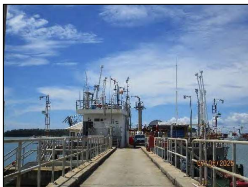
ท่าเทียบเรือขนถ่ายผลิตภัณฑ์ปิโตรเลียม