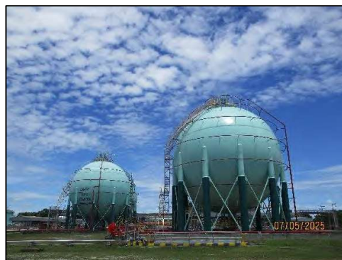
คลังก๊าซปิโตรเลียมเหลว