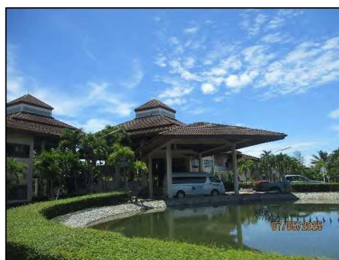
ภาพถ่ายที่ 1.4.2-1 ส่วนประกอบของโครงการ