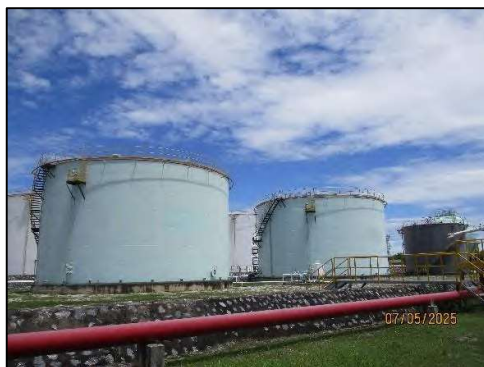
คลังน้ำมัน