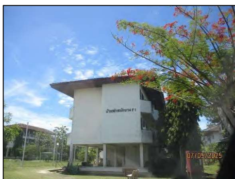
ศูนย์ฝึกอบรมและบ้านพัก